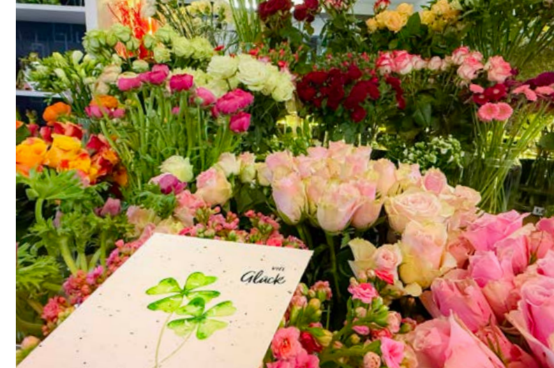
Kaum etwas macht so dankbar und glücklich, wie ein schöner Blumenstrauß: In der Blumengalerie erhalten Sie eine besonders große Vielfalt.