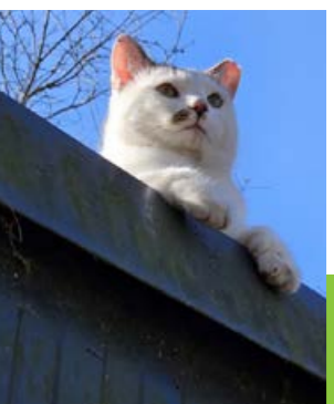
Sir Miezius Maximus ... Seine Majestät sucht ein ruhiges Königreich mit Freigang. Streicheleinheiten gibt's nach höfischer Absprache. Für erfahrene Katzenfans mit Sinn für Etikette – kein Schoßkater, aber ein Charakter mit Stil.

Der Clou: Die Tierschützer tauschen die Eier regelmäßig gegen Attrappen aus. So wird der Bestand gezielt reduziert und Tierleid vermieden.