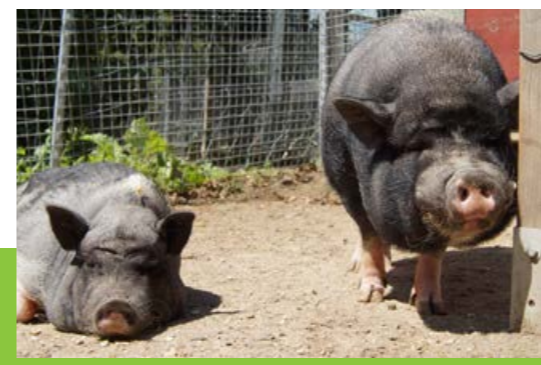
Piggeldy & Susi ... Zwei Minischweine mit großem Herz suchen ein neues Zuhause – unbedingt gemeinsam und gern in Gesellschaft weiterer Schweine. Das eingespielte Duo beweist: Zusammen ist's einfach schöner.